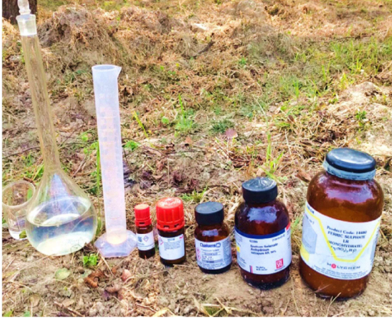
चित्र 2: बेर फसल में जैव-संवर्धन हेतु प्रयोग में लाए गए रसायन एवं मापन उपकरण