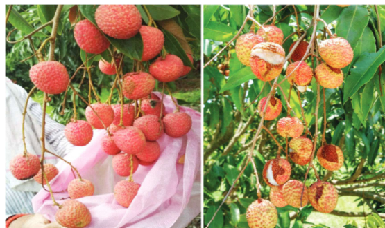
बैगिंग और बिना बैगिंग वाले लीची फल