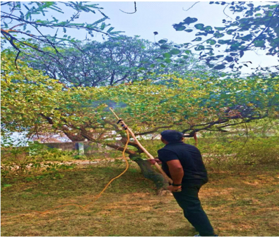
चित्र 1 : बेर वृक्ष में सूक्ष्म पोषक तत्वों के जैव-संवर्धन हेतु पर्णाय छिड़काव

कृषि प्रबंधन आधारित जैव-संवर्धन एक ऐसी व्यावहारिक तकनीक है जिसमें उर्वरक प्रबंधन, पर्णाय छिड़काव तथा मृदा संशोधन के माध्यम से फसलों में आवश्यक सूक्ष्म पोषक तत्वों की मात्रा बढ़ाई जाती है। बेर जैसी फल फसल में इस विधि के माध्यम से आयोडीन, सेलेनियम, आयरन और जिंक जैसे महत्वपूर्ण तत्वों की मात्रा को प्रभावी रूप से बढ़ाया जा सकता है।