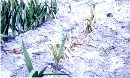
ग्लैडियोलस में लगने वाले प्रमुख रोग

प्रबंधन: शुरु में सुण्डियो को एकत्र कर नष्ट कर दे। बेसिलस थुरिजेंसिस 1-1.5 ग्राम प्रति लीटर पानी (छोटे लार्वा पर अधिक प्रभावी)। नीम तेल 3.5 मिली लीटर प्रति लीटर पानी या अजाडिरैक्टिन 3 मिली लीटर प्रति लीटर पानी का छिड़काव करें। इमामेक्टिनबेंजोएट 0.4 ग्राम लीटर प्रति लीटर पानी या इंडोक्साकार्ब 0.5 मिली लीटर प्रति लीटर पानी या क्लोरान्त्रानिलिप्रोल 0.3 मिली लीटर प्रति लीटर पानी का छिड़काव करें। 7-10 दिन के अंतराल पर पुनः छिड़काव करें। अंडे या छोटे लार्वा की अवस्था में छिड़काव करें।