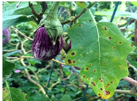
पत्ती धब्बा रोग