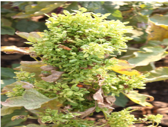
छोटी पत्ती रोग ( लिलिटल लीफ )